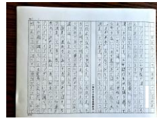
作文「自由なアメリカ 自律している日本」